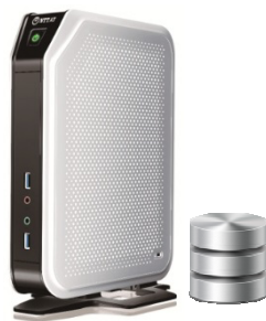
ミニ稼働サーバー：SSD128GB・メモリ8GB