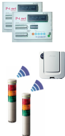
各種設備稼働 実績収集装置