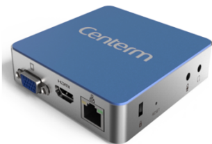
ゼロクライアント

サイズが小さかつファンレス設計です。VESAマウントや盗難防止のケンジントンロックに対応しています。